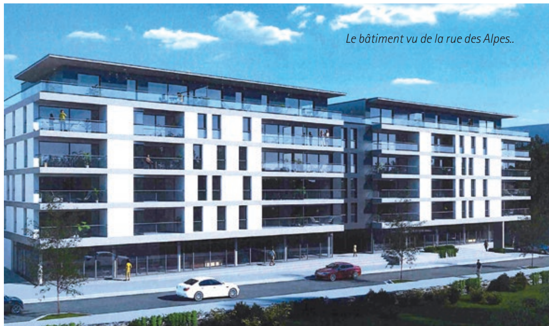
Le bâtiment vu de la rue des Alpes..