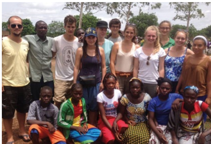
Des rencontres inoubliables!

nous, les Nasaara (blancs en langage moré) sommes partis à la découverte du Burkina Faso qui signifie pays de l'homme intègre.