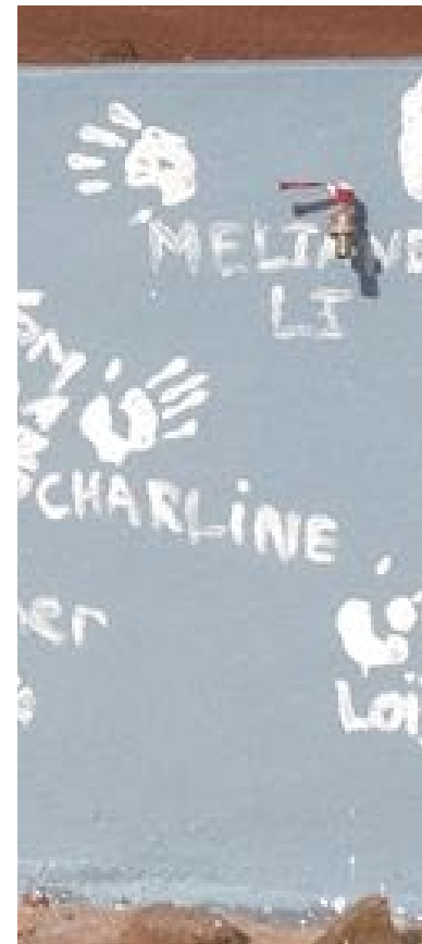
Un coup de mains pour l'eau!

Nous sommes sortis grandis de ce voyage. Pendant 3 semaines, nous avons vécu une autre réalité: celle où dès son plus jeune âge chaque membre