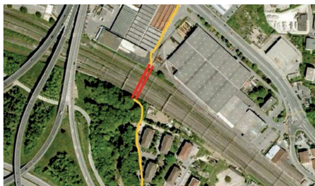
Le projet reporté. En jaune, le tracé prévu.

Un autre projet de mobilité douce est en cours, à partir de quartier de Pré-Fontaine à Crissier jusqu'aux Hautes Écoles, le long de l'Avenue du Tir Fédéral. En partenariat avec le canton et Chavannes-près-Renens, les municipalités de Crissier et Écublens s'engageront fortement pour que ce projet se réalise le plus rapidement possible. Il comporte notamment un élargissement du Pont-Bleu ainsi qu'une piste cyclable dès la sortie de la galerie de Marcolet. Nous disposerons ainsi d'une voie cyclable nord-sud dans l'Ouest lausannois. À terme, avec le prolongement de la ligne de tram jusqu'à Bussigny, un ascenseur entre le boulevard de l'Arc-en-Ciel et le Pont Bleu est envisagé, ce qui améliorera encore notre réseau cyclable.