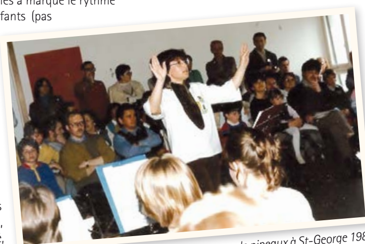
Concert final du camp de pipeaux à St-George 1985.