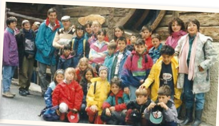
Camp à St-Luc 1995.