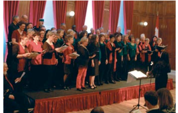
L'Harmonie en concert à Dublin (République d'Irlande).