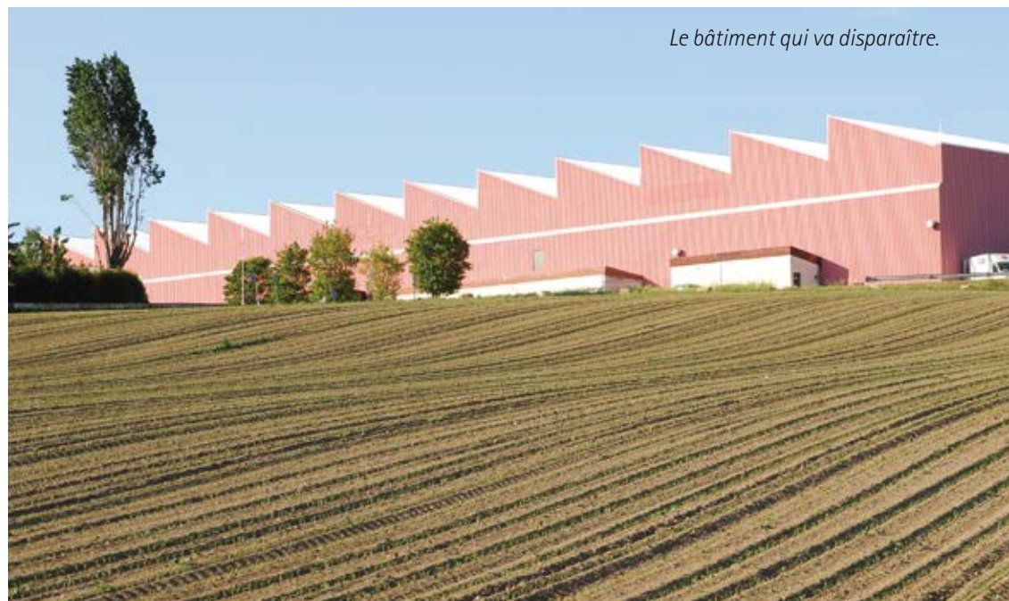
Le bâtiment qui va disparaître.

Le Conseil communal se prononcera définitivement sur ce projet dans sa séance du 4 mai prochain.