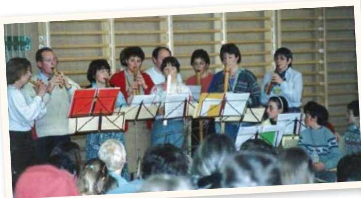
Concert final du camp de pipeaux à St-George 1988.