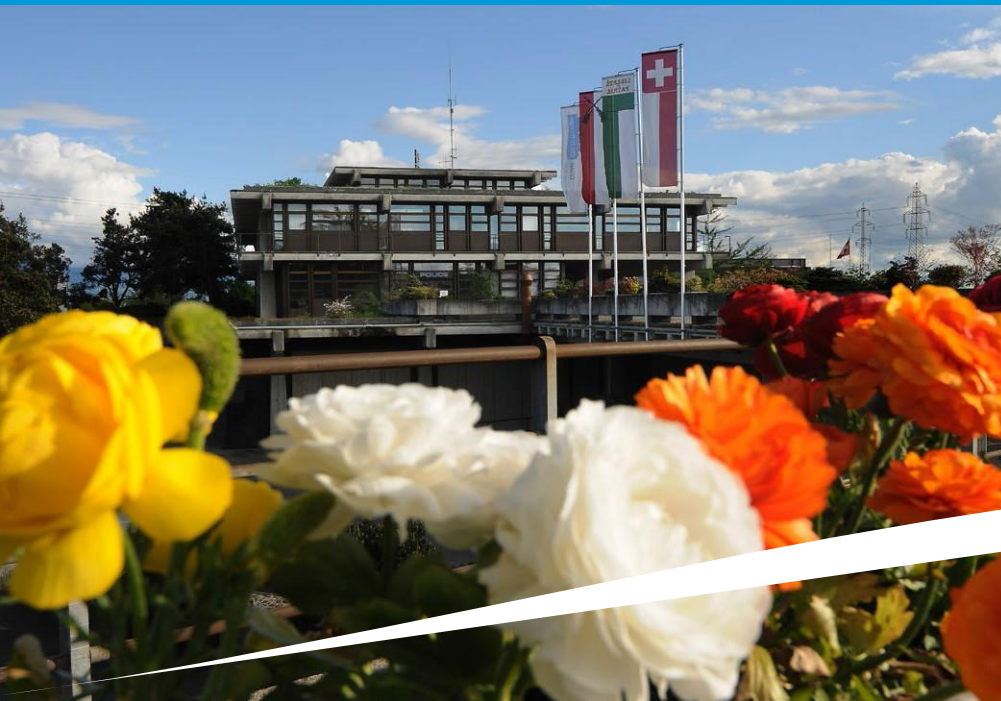
Le bâtiment administratif de Crissier